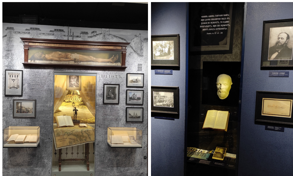
Илл. 18–19. Кадры с литературной экспозиции «Ф. М. Достоевский. Жизнь и творчество: pro et contra».

стажем писал о том, что эта книга во многом изменила его представление о романе — и уроки в десятых классах в 2006–2007 учебном году он вел уже по-другому 7 .