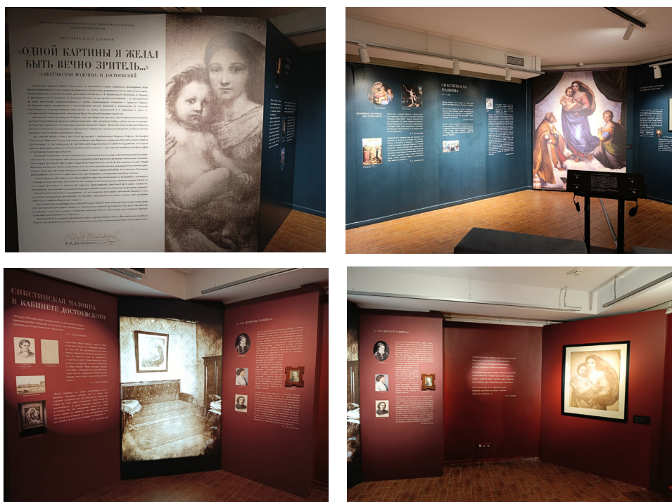
Илл. 14–17. Кадры с выставки «"...Одной картины я желал быть вечно зритель". "Сикстинская Мадонна" и Достоевский» (2025). Фото И. С. Андриановой