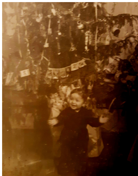
Илл. 1. Боря Тихомиров (январь 1955)

Эти строки из стихотворения С. Я. Маршака «Бессмертие» цитировал Борис Николаевич Тихомиров 13 января 2025 г., размещая на Старый Новый год в социальной сети свою детскую фотографию возле елки. 28 августа 2025 г. в возрасте 72 лет он скоропостижно ушел в вечную жизнь — невозможно трудно поверить в этот прерванный полет всем, знавшим и любившим его. Не стало президента Российского общества Достоевского, выдающегося исследователя биографии и творчества писателя, а отечественная филологическая наука понесла огромную, невозполнимую потерю (см. публикации памяти Б. Н. Тихомирова: [Подосокорский], [Борисова], [Сафронова]).