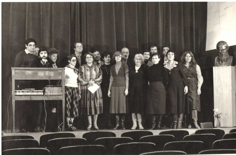
Илл. 8. Участники VIII конференции «Достоевский и мировая культура».