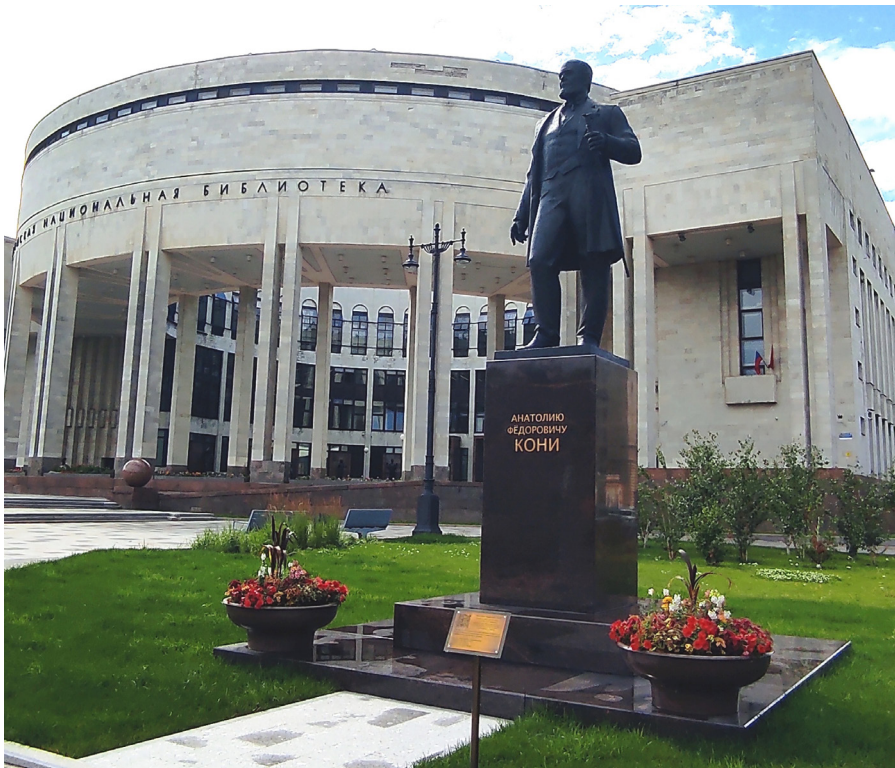
Илл. 3. Памятник А. Ф. Кони в Санкт-Петербурге.

Символично, что в год 180-летия со дня рождения А. Ф. Кони, выдающегося правоведа и талантливого писателя, ему установлен памятник возле одного из крупнейших мировых центров чтения — Российской национальной библиотеки в Санкт-Петербурге.