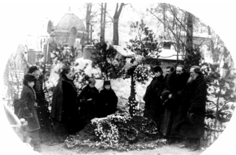
Илл. 4. А. Г. Достоевская с родными и знакомыми на могиле Ф. М. Достоевского. 5 февраля 1881 г.