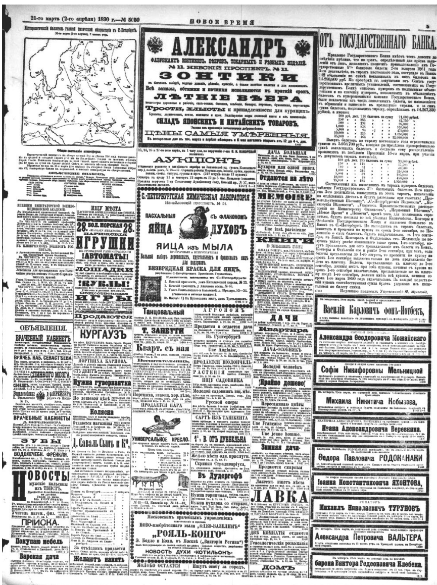
Илл. 2. Страница из газеты «Новое время» (№ 5050 за 1890 г.), в которой был размещен некролог об И. А. Веревкине Fig. 2. A page from the newspaper "Novoe Vremya" (No. 5050 for 1890), which contained an obituary about I. A. Verevkin