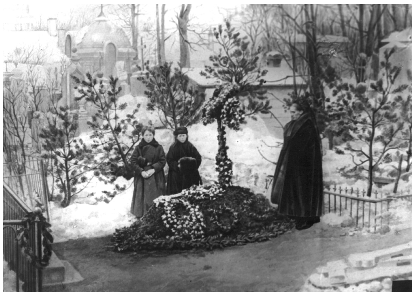
Илл. 3. Вдова и дети Ф. М. Достоевского на его могиле. 5 февраля 1881 г. Фото В. Я. Рейнгардта (ГЛМ. КП-34363)