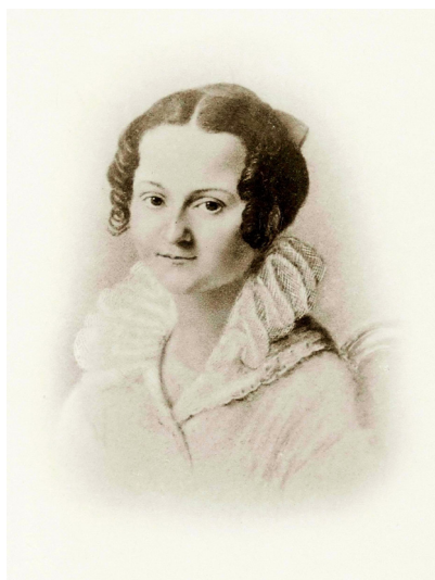
Илл. 1–2. М. А. и М. Ф. Достоевские, родители писателя.

Фотокопии 1866 г. с пастельных портретов работы Ф. И. Попова (сентябрь 1823 г.).