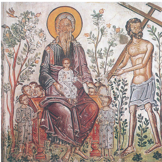
Илл. 2. Разбойник в раю. Святой монастырь Русану (Греция). XVI в.

В трижды повторенном местоимении «там» О. Меерсон также обнаружила конкретную отсылку к библейскому «лону Авраамову» [Меерсон: 20], созерцание которого вызывает у Раскольникова необъяснимую тоску. Это тоска по раю, соотнесенному в данном случае с «лоном Авраамовым», хронотоп которого вызывает ассоциации с палестинской пустыней, где когда-то жило племя первого патриарха. Созерцая «долину Авраама», Раскольников, подобно благоразумному разбойнику, изображенному на одной из икон, словно оказывается рядом с праотцом. В этой связи О. Меерсон справедливо подчеркнула, что здесь «вырисовывается <...> именно картина» [Меерсон: 26], вербально воспроизведенная Достоевским.