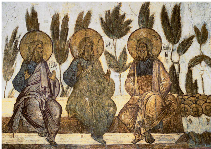
Илл. 1. Лоно Авраамово (праотцы Иаков, Исаак и Авраам). Успенский собор во Владимире. Даниил Черный, ок. 1408 г.