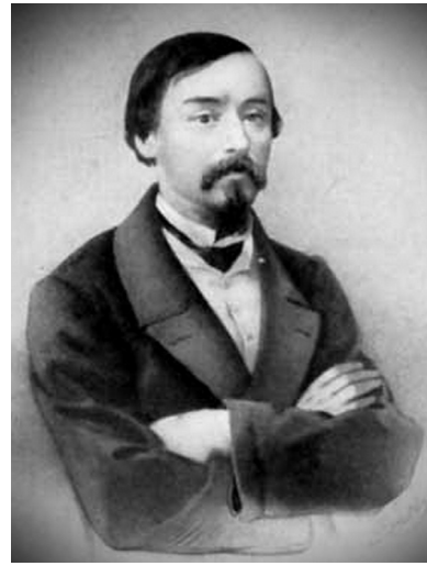
Илл. 2б. Н. А. Некрасов. (Литография П. Ф. Бореля, 1850-е гг.)

Fig. 2a. D. V. Grigorovich. (Lithography of 1854)