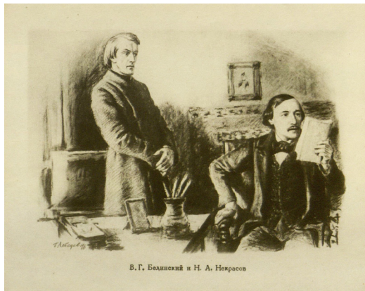
Илл. 6. Белинский и Некрасов.

Фрагмент черновой рукописи повести Некрасова, впервые обнаруженный К. И. Чуковским, был опубликован в журнале «Нива» в 1917 г. Действующими лицами повести Некрасова являются реальные лица, входившие в литературный круг Белинского: Ф. М. Достоевский (Глажиевский, Решетилов), В. Г. Белинский (Мерцалов, Ветлугин), Н. А. Некрасов (Чудов, Тростников) (Илл. 6), И. И. Панаев (Разбегаев), П. В. Анненков (Спутник) (Илл. 7), Д. В. Григорович (Балаклеев) (Илл. 8), И. С. Тургенев (Мальчишка) (Илл. 9), Н. Я. Тютчев и М. А. Языков (Практическая голова), Н. Х. Кетчер (Парутин) и др. 10