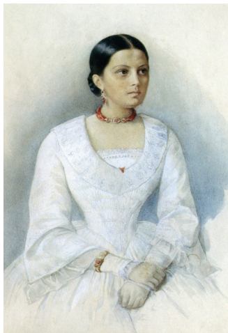
Илл. 3. А. Я. Панаева. (Портрет работы К. И. Горбунова)

«Раз Тургенев при Достоевском описывал свою встречу в провинции с одной личностью, которая вообразила себя гениальным человеком, и мастерски изобразил смешную сторону этой личности. Достоевский был бледен как полотно, весь дрожал и убежал, не дослушав рассказа Тургенева. Я заметила всем: к чему изводить так Достоевского? Но Тургенев был в самом веселом настроении, увлек и других, так что никто не придал значения быстрому уходу Достоевского. Тургенев стал сочинять юмористические стихи на Девушкина, героя “Бедных людей”, будто бы тот написал благодарственные стихи Достоевскому [за то], что он оповестил всю Россию об его существовании, и в стихах повторялось часто “маточка”» 5 .