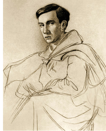
Илл. 8. Д. В. Григорович. (Автопортрет. 1840-е гг.) Fig. 8. D. V. Grigorovich. (Self-Portrait. 1840s)