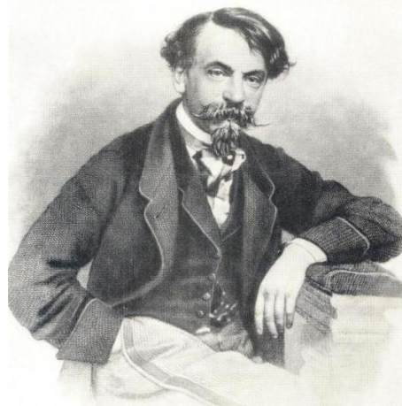
Илл. 2д. И. И. Панаев. (Литография П. Ф. Бореля)

Fig. 2c. V. G. Belinsky. (From the Lithography of the 1860s)