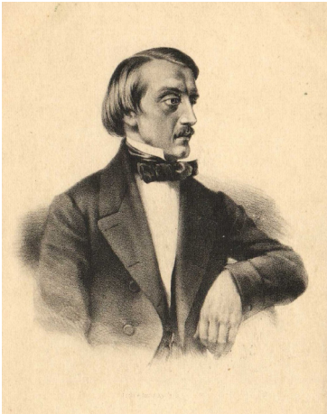
Илл. 2с. В. Г. Белинский. (С литографии 1860-х гг.)

Fig. 2b. N. A. Nekrasov. (Lithography by P. F. Borel, 1850s)