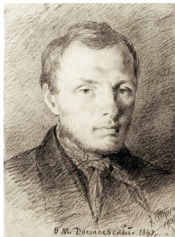
Илл. 1б. Ф. М. Достоевский. (К. А. Трутовский, 1847)