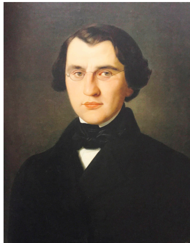
Илл. 9. И. С. Тургенев. (Портрет работы В. Лами, 1844) Fig. 9. I. S. Turgenev. (Portrait by V. Lami, 1844)