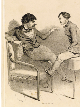
Илл. 4. Карикатура Н. А. Степанова на Н. А. Некрасова и И. И. Панаева. («Иллюстрированный Альманах», 1848)

В 1855 г. после выхода Достоевского из каторги нападки на него возобновились, когда в двенадцатом номере «Современника» под псевдонимом «Новый поэт» И. И. Панаев опубликовал фельетон «Литературные кумиры и кумирчики».