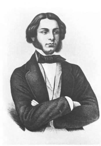
Илл. 2а. Д. В. Григорович. (Литография 1854 г.)

Fig. 2a. D. V. Grigorovich. (Lithography of 1854)