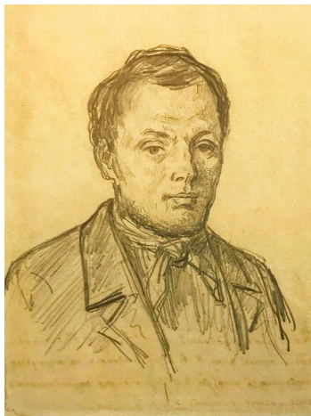
Илл. 1а. Ф. М. Достоевский. (К. А. Трутовский, 1847)