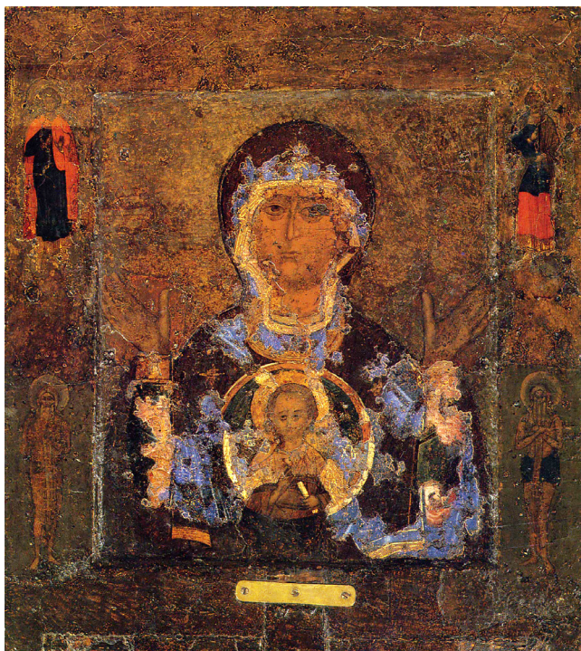
Илл. 3. Чудотворная икона Божией Матери «Знамение». Первая половина XII в.

стене. Осаждавшие выпустили по крепости множество стрел, и одна из них попала в лик Божией Матери, из глаз Которой полились слезы. Войска Андрея Боголюбского были объаты ужасом, побросали оружие и стали поспешно отходить от крепости. Новгородцы преследовали противника и одержали полную победу.