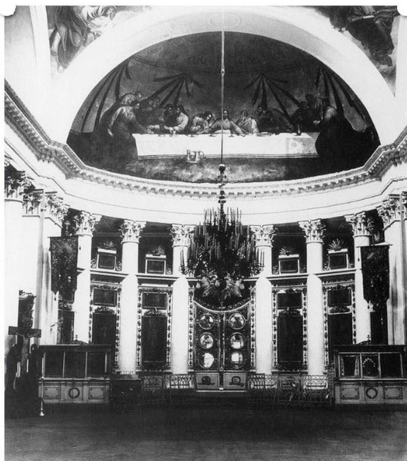
Илл. 4. Интерьер Знаменской церкви в Петербурге. Фотография А. Функа. 1918

В силу сказанного представляется более предпочтительным заключить, что в подготовительных материалах к «Подростку» упоминается древний чудотворный список с новгородского образа Богоматери «Знамение», датируемый в церковной литературе 1175 г. Надо полагать, и Достоевский молился именно перед этой иконой. Список 1744 г., судя по всему, находился в Знаменском приделе храма. Древний чудотворный образ Знаменской Божией Матери кисти Христофора Семенова должен был находиться в главном церковном приделе во имя Входа Господня в Иерусалим (но точных указаний на это не обнаружено).