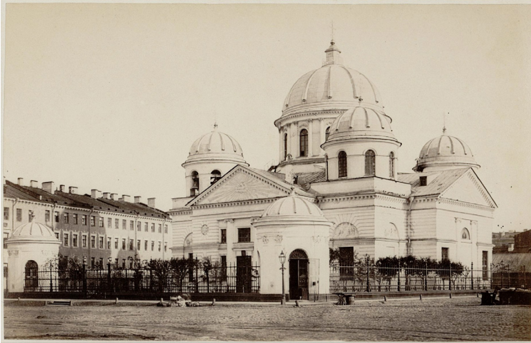
Илл. 1. Знаменская церковь. 1865–1870

только в 1957 г. 6 , грубо копируя стиль уничтоженного памятника» [Антонов, Кобак: 174]. С целью получить представление об этом варварски уничтоженном петербургском храме, обратимся к исторической литературе.