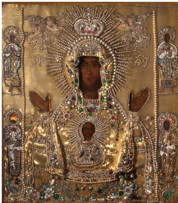
Илл. 5. Икона Божией Матери «Знамение» кисти Христофора Семенова. 1175 (?)

с молитвенно поднятыми руками, обращенными ладонями к молящимся (иконографический тип «Оранта»), с Богомладенцем Спасом-Эммануилом на лоне, заключенным в круг. На полях иконы помещены ростовые фигуры 25 святых Георгия Победоносца, Иакова Персянина, Петра Афонского и Онуфрия Великого (или Макария Египетского). «Писана на деке. Длина ее — 14½ вершков, ширина 11½ вершков. Вставлена в старинный серебряный — вызолоченный оклад, покрытый новою серебряною — вызолоченною ризою с двумя венцами древней филогранной [так!] работы, украшенными 23 рубинами, 13 изумрудами, 2 гиацинтами, 2 перлами, 4 халцедонами и 4 гранатами» 26 .