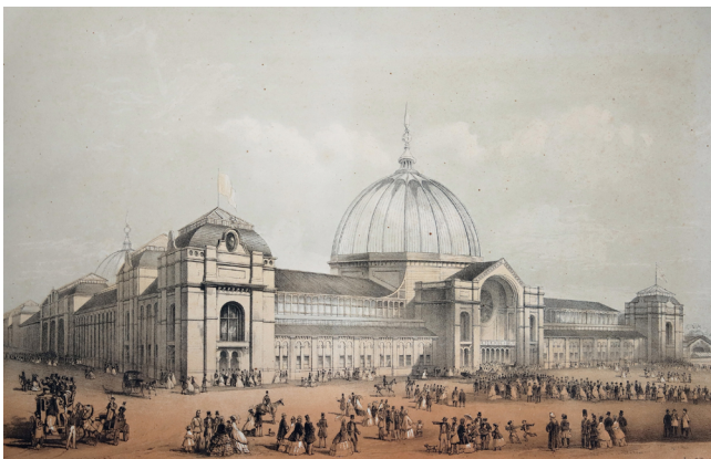
Илл. 1. Здание Всемирной выставки в Лондоне 1862 года. («Crystal palace»). Литография В. Тимма. 1862

«Уж не это ли, в самом деле, достигнутый идеал? — думаете вы; — не конец ли тут? не это ли уж, и в самом деле, “едино стадо”. Не придется ли принять это, и в самом деле, за полную правду и занеметь окончательно? Все это так торжественно, победно и гордо, что вам начинает дух теснить <...> Это