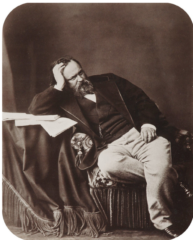
Илл. 2. А. И. Герцен. Париж. 1861 Fig. 2. A. I. Herzen. Paris. 1861

«К тебе приедет наш знаменитый Достоевский. Он хочет Ольгин портрет — если есть, дай» 22) .