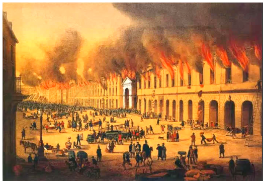
Илл. 5. Пожар в Апраксином дворе 28 мая 1862 г. Литография

Во всей периодике того времени мы не встретим столь откровенной и страстной защиты студенческого сословия. О самой же прокламации «Молодая Россия» Достоевский говорит, что, скорее всего, ее составители — «три золотушных школьника, из которых старшему уже, наверное, не более