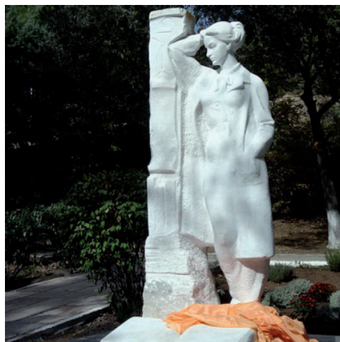
Илл. 4. Памятник Н. Сусловой на территории городской больницы в г. Алушта

Мечты и чаяния А. П. Сусловой того времени были связаны с писательской деятельностью. В пятом томе журнала «Время» за 1861 г. состоялся ее литературный дебют — за подписью «А. С-ВА» появилась первая повесть «Покуда». Это произведение как раз затрагивало тему женской эмансипации.