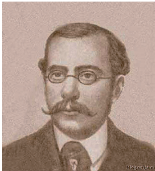
Илл. 1. К. П. Вильбоа 10

любителей, способных наслаждаться ( dilettare ) предметами искусства. Дилетантизм весьма актуален для первой половины и 60–70-х гг. XIX столетия — времени деятельности Балакиревского кружка «Могучая кучка». Это «явление очень мощное, почвенное для России и притом чрезвычайно противоречивое, — пишет Н. А. Миронова. — Он ассоциировался с большим, чем любительство, — с духовной свободой, с возможностью реализации творческих сил человека, и это придавало ему особый ореол. Известно, что русская музыкальная культура XVIII века в большой мере создавалась просвещенными дилетантами» [15, 13]. Обратную сторону этого явления указал Б. С. Штейнпресс: «Росту национального искусства мешало не только пассивное подражание иностранным образцам. Сильным тормозом был дворянский дилетантизм. Музыка все еще не представлялась серьезной отраслью творческого труда и общественной деятельности» [23, 165].